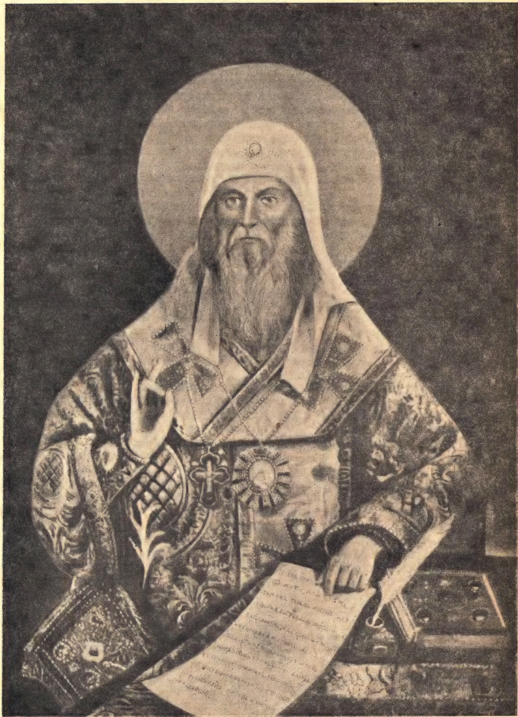
Святитель Алексий, Митрополит Московский и всея Руси